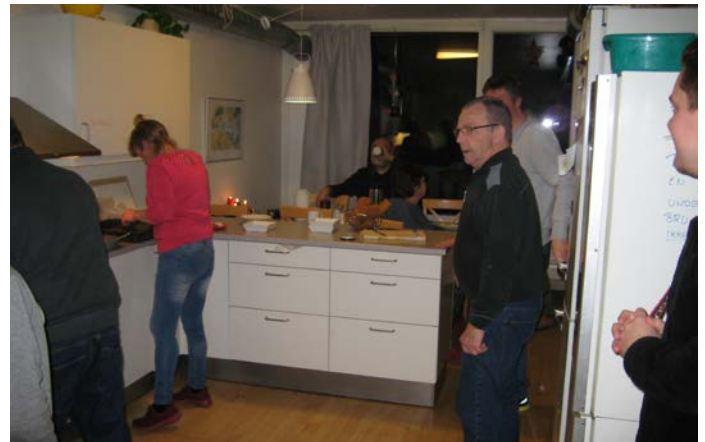
Travlhed i køkkenet.