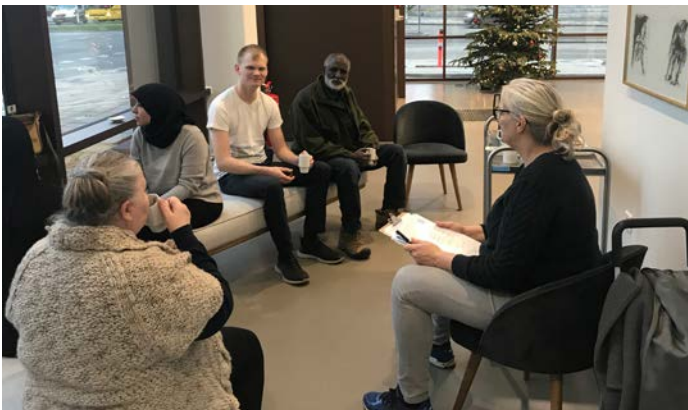
Seks torsdage har afdelingsbestyrelsen holdt info-cafe i boligforeningens foyer.

Beboerinfo cafeen holder i denne omgang åbent for sidste gang torsdag den 6. februar.