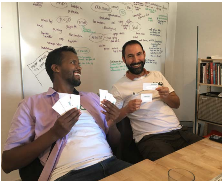
To Baba'er sidder foran tavlen med alle dagens stikord og udvælger, hvilke kort med aktiviteter og fokuspunkter de skal tage med hjem, til holdet mødes igen ugen efter.