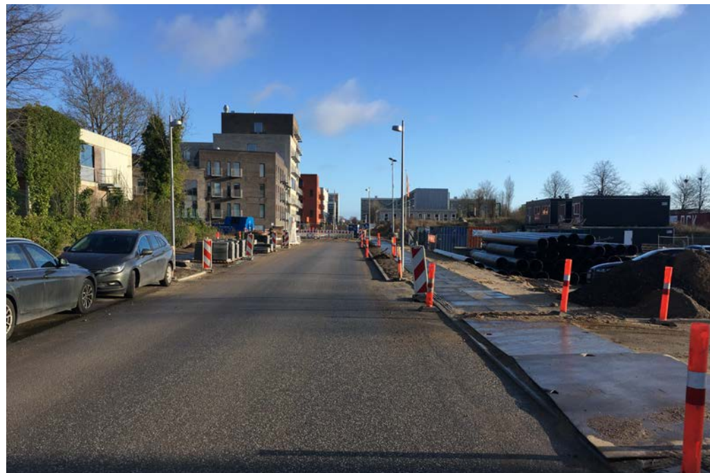
Der mangler også cykelstier på Lottesvej.