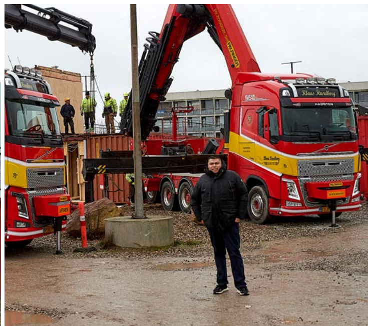
Chadi flytter med E&P Huset, når det åbner i marts.

Det er en langsommelig affære at flytte sådan en container, det tager nemlig cirka halvoanden time med af- og pålæsning.