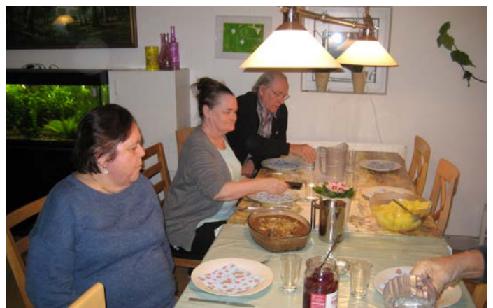
Nu kan de endelig tage for sig af retterne.