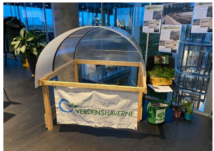
En model af tunnelen udstillet til Samvirkets årsmøde.