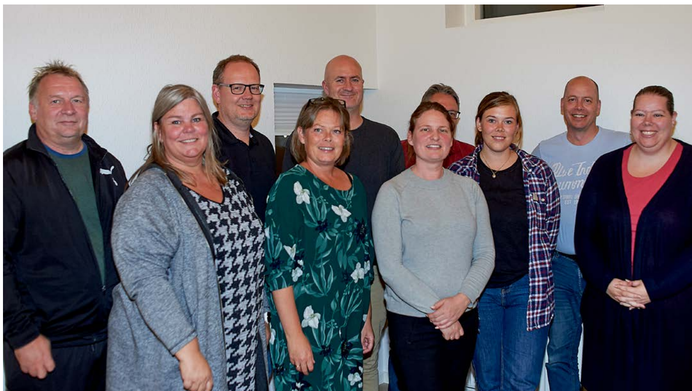
Billede af alle deltagerne til beboermødet.