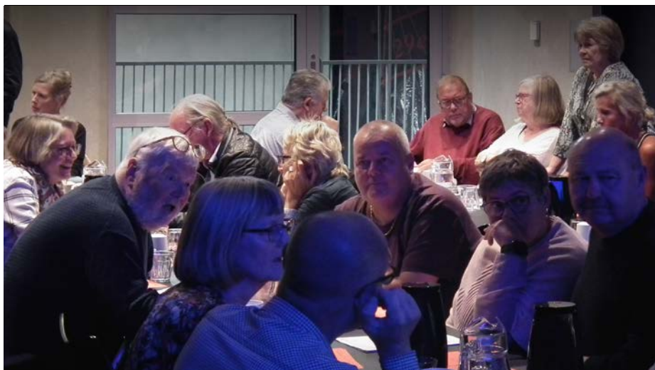
Det blå lys fra storskærmen gav en særlig stemning.