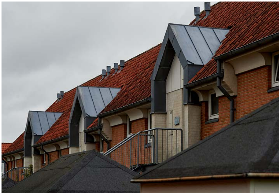
Her i kvistene er der konstateret skimmelsvamp.