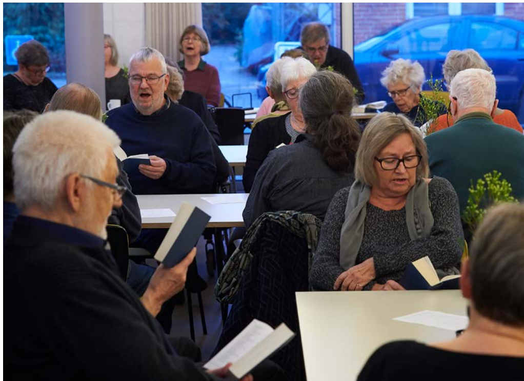
Der sker meget på Lokalcenter Brabrand, som her tilbage i marts, hvor Skræppen var forbi til fællessang.