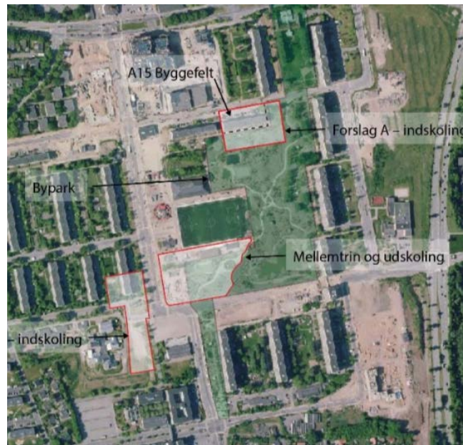
Skolegården kommer til at inddrage noget af Joops Have - her ved det, der i daglig tale hedder benzintanken.