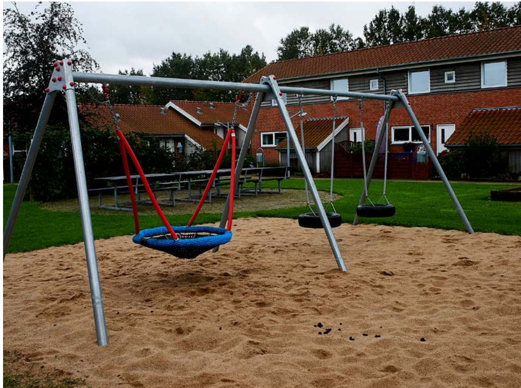
Beboerne er meget stolte af det nye gyngestativ i gård to.

Derudover blev det nævnt, at der er konstateret, at målerne i vaskeri og fælleshus målte forkerte data. De grønne områder forbedres stadig, og